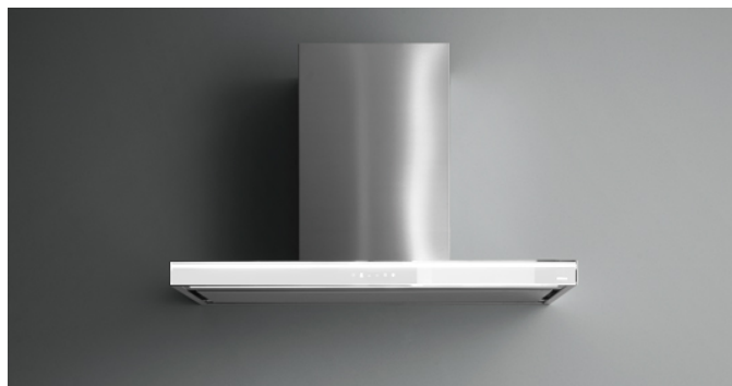
Das Bild dient rein einer groben Information. Es kann von der ausgewählten Version abweichen.