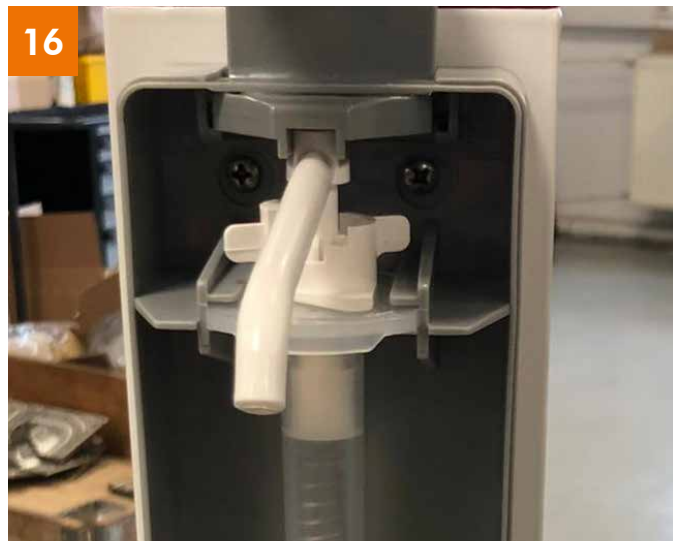
Spender: Schrauben anziehen