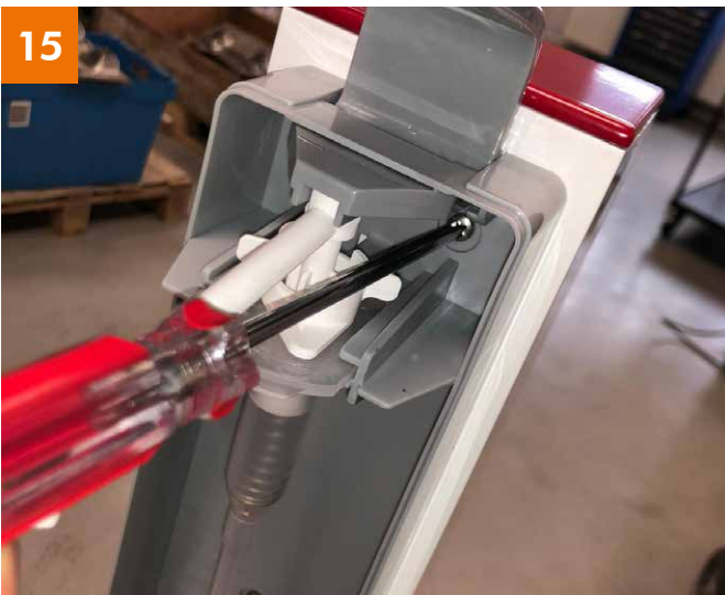
Spender: Fixierung mit 3 Schrauben