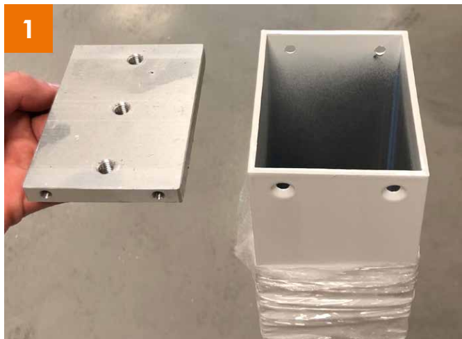
1 Fuß: Fixierung für Bodenplatte einsetzen