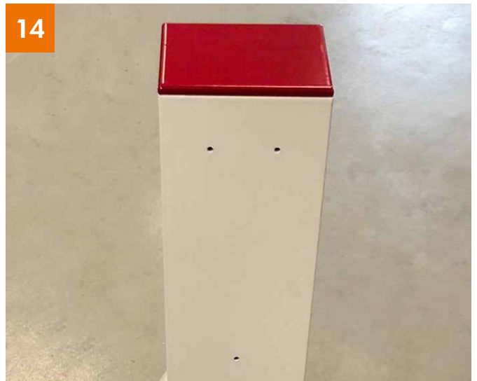
Spender: Löcher zur Fixierung