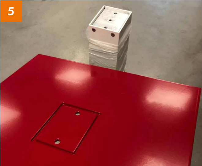
Fuß: Bodenplatte Unterseite