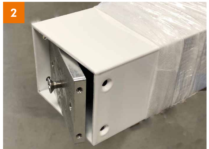
2 Fuß: Mittelschraube als Anfasser