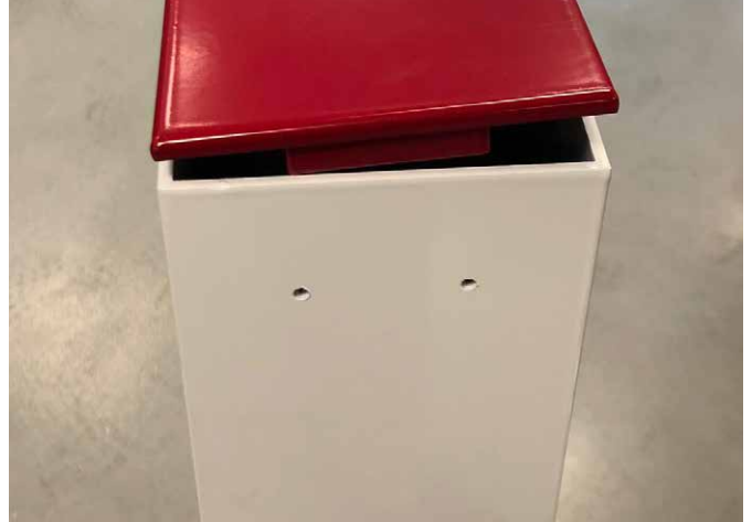
Deckel: Platte wenden und einsetzen