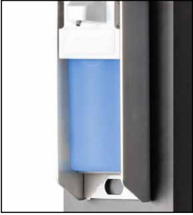
Spender: Behälter einsetzen