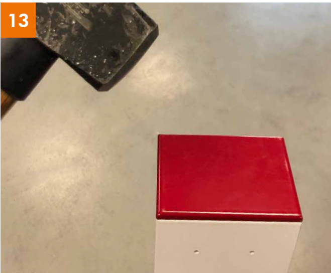
Deckel: Fixierung mit Gummihammer