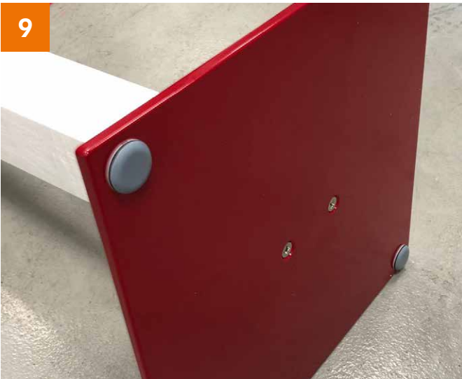
Fuß: Fixierung an den 4 Ecken