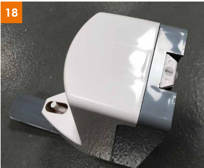
Spender: Vordere Abdeckung fixiert