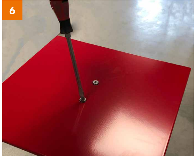
Fuß: Bodenplatte wenden und Fixieren