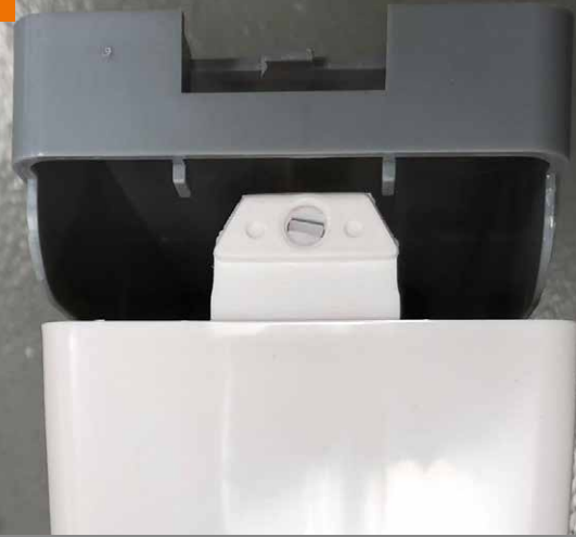
Spender: Vordere Abdeckung einrasten