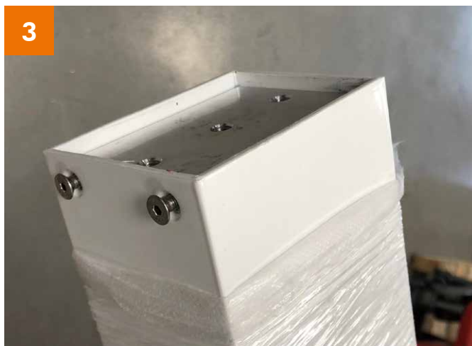
3 Fuß: Fixierung mit seitlichen Schrauben