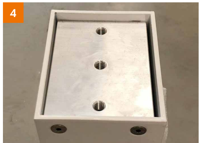
4 Fuß: Schrauben anziehen (4 Stück)