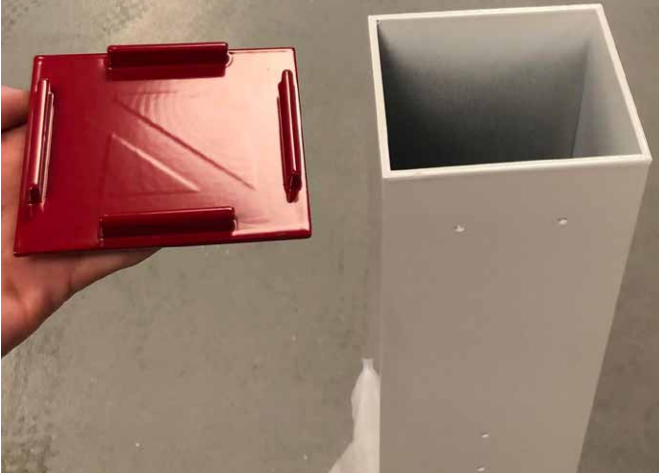
Deckel: Obere Abschlussplatte